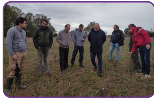
Rallye Herbe du collectif GIEE "Elevage en AB et changement climatique : comment être résilient ?" - novembre 2023