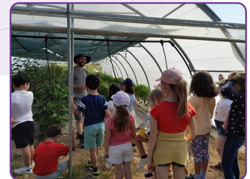
Visite de la Ferme des Beaux Regards dans le cadre des animations en écoles primaires de Bourges - juin 2023