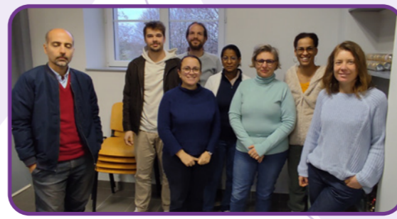
Présentation des actions du GABB18 auprès des BPREA du Lycée agricole - décembre 2023