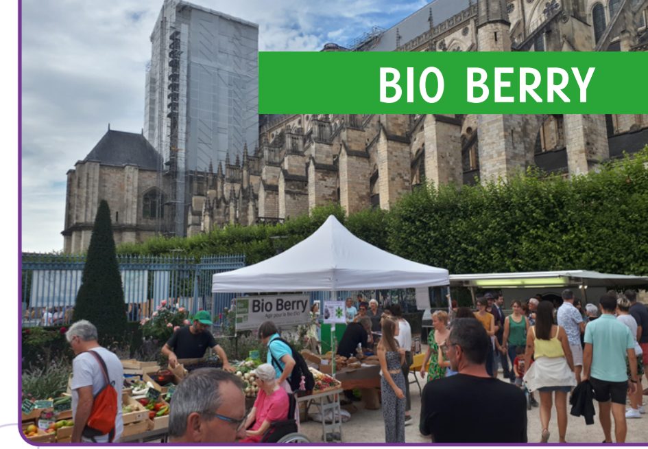
Bourges se fait bio 2023 - septembre 2023