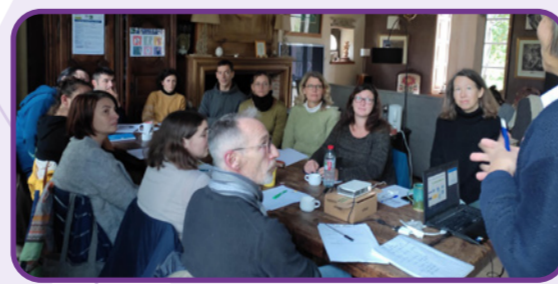
Formation : transformation des produits de l'exploitation : Comprendre la réglementation sanitaire - novembre 2023