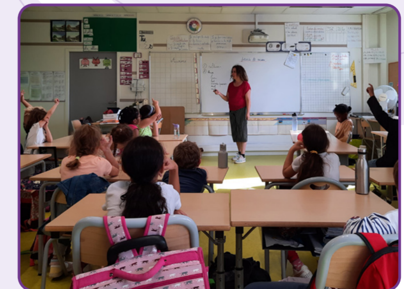
Intervention auprès d'une classe de CM1 "comment fabrique-t-on du fromage ?" - octobre 2023