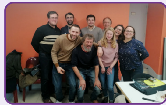
Réunion technique fertilisation et bilan du GIEE "Elevage en AB et changement climatique : comment être résilient ?" - décembre 2023