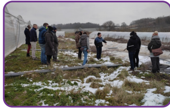
Voyage d'étude Maraîchage : Dérèglement climatique : adopter un pilotage agronomique et économe de l'irrigation en maraîchage bio - janvier 2023