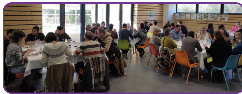
Assemblée générale du GABB18 - mars 2023