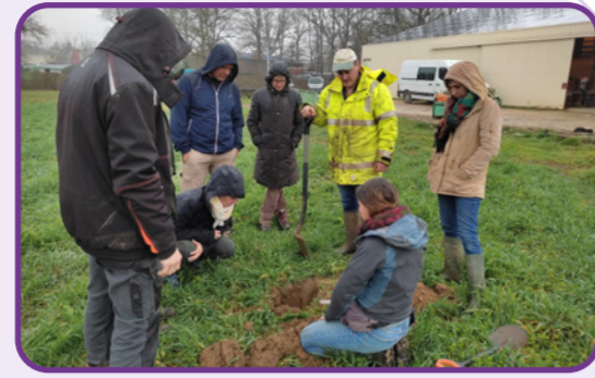
Réunion technique Maraîchage "Engrais verts" - février 2023