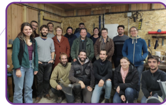
Réunion technique Maraîchage "Qualité et conservation des légumes" - novembre 2023