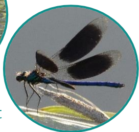
Grenouille et Caloptéryx éclatant